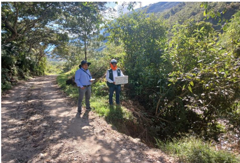
FIGURA N°03: CARRETERA EXPUESTO ANTE CAIDA DE PLATAFORMA POR EROSION DE BASE PERMANENTE DEL RÍO SALKANTAY EN LA MARGEN IZQUIERDA