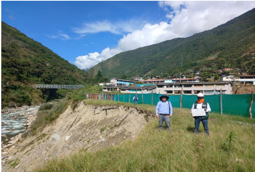
FIGURA N°02: INSTITUCION EDUCATIVA INICIAL, PRIMARIA Y SECUNDARIA EXPUESTOS ANTE CAIDA DE PLATAFORMA POR EROSION DE BASE PERMANENTE DEL RÍO SALKANTAY EN LA MARGEN IZQUIERDA

Ministerio de Desarrollo Agrario y Riego