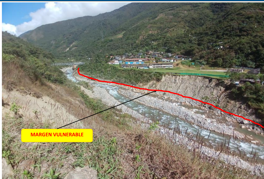
FIGURA N°01: TRAMO CRÍTICO EN EL RÍO SALKANTAY , EN EL SECTOR SAHUAYACO, DISTRITO DE SANTA TERESA, PROVINCIA DE LA CONVENCIÓN.